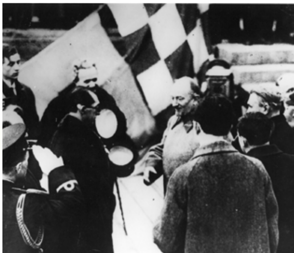
Наркоминдел РСФСР Г. Чичерин встречает главу делегации кемалистской Турции Юсуфа Кемаля Тенгиршенка, прибывшей в Москву для подписания договора о дружбе с РСФСР

Автономизация Нахчывана, а точнее международно-правовое признание и обеспечение ее особого политико-правового статуса в составе Азербайджана, преследовала геополитическую (и одновременно внутривнутриполитическую для РСФСР) цель снижения остроты напря-