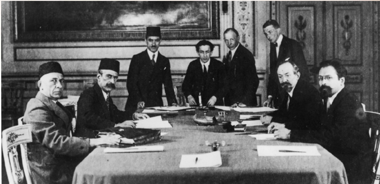
После подписания Московского Договора между РСФСР и кемалистской Турцией: с правой стороны делегация РСФСР во главе с наркоминдел Г.Чичерином, а с левой стороны делегация Кемалистской Турции во главе с Ю.К.Тенгиршеком

Северного Азербайджана. Поэтому объемы и пределы этого политико-правового режима советским дипломатам из истории были хорошо известны. Юридическая сущность режима протектората не менее хорошо была известна и турецкой стороне, так как в XVI-XIX веках под протекторатом Османской империи находились Крымское ханство, Тунис и Триполитания. Исходя из этих универсальных представлений, протекторат АССР над Нахчыванским округом в соответствии с положениями Московского договора представлял собой форму межгосударственных отношений, при которой одна страна признавала над собой верховный суверенитет другой, прежде всего в международных отношениях, сохраняя автономию во внутренних делах и собственную династию, заменявшуюся в реалиях советского строя на самостоятельную совокупность органов власти и управления. Подобная форма государственно-политической соподчиненности, по мнению большевиков и кемалистов, в начале 1921 года наиболее адекватно учитывала специфику взаимоотношений Азербайджана и Нахчывана. Потому-то термин «протекторат» был использован ими в тексте соответствующей статьи Московского договора.