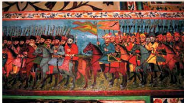
Воины азербайджанских ханств. Настенная роспись дворца шекинских ханов. Фрагмент. Вторая половина XVIII века

Таким образом, сложилась реальная перспектива ухода Российской империи с Кавказа. Особо остро вопрос ее дальнейшего присутствия в этом регионе встал в начале сентября 1812 г., когда французские войска вступили в Москву, а персидский шах, поверив заверениям французских эмиссаров, прервал мирные переговоры и направил в земли современного Азербайджана свою вновь собранную армию. Но воля Н.Ф. Ртищева, храбрость генералов и нижних чинов позволили изменить ход событий: внешние и внутренние враги России в течение двух лет были разбиты на всех направлениях. Генерал Котляревский победой в сражении на Асландузских бродах 19-20 октября и штурмом Ленкярана в ночь на 1 января 1813 г. заставил персов возобновить мирные переговоры, а полковник А.И.Пестель, разгромив эриванского сердара при Кара-Бюрке, – просить о