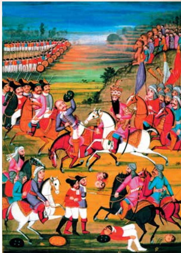
Фатали шах убивает русского генерала. Персидская миниатюра каджарской школы. 1810-е гг.

Второй раздел Польши 1792 г. стал причиной перевода Ртищева в состав заграничной армии