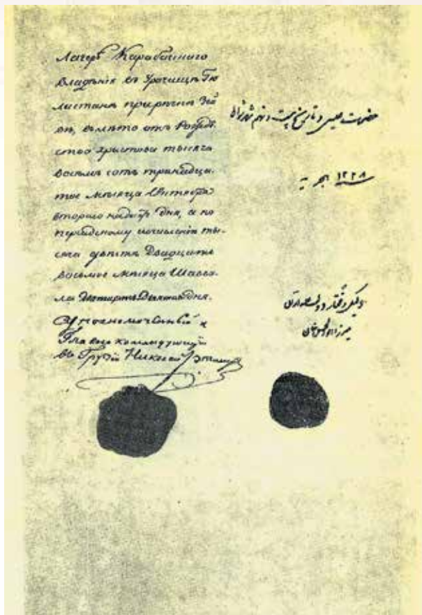
Подпись Н.Ф. Ртищева на оборотной стороне Гюлистанского мирного договора 1813 года

ческие отношения азербайджанских ханств, сохранявших свою административную автономию, оказались значительно упорядочены, благодаря ликвидации прежних внутренних торговых пошлин, а местные беки и купцы получили право свободной торговли не только во всем Закавказье, но и в России.