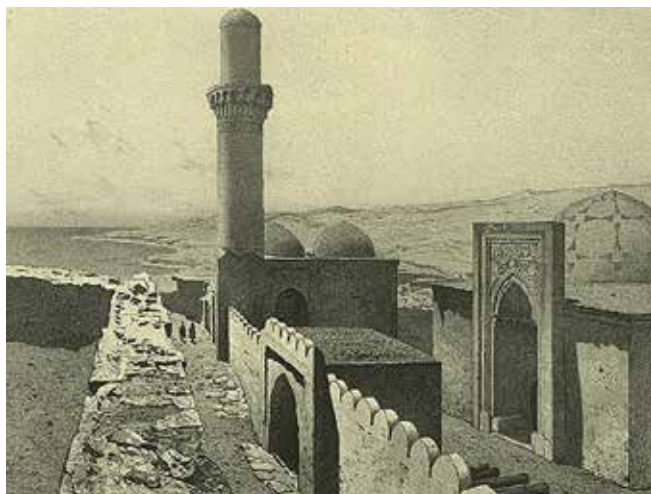
Abcheron. Palais du khan de Bakou

les portes de ville, introduisant fréquemment dans ses dessins, pour les rendre plus vivants, des personnages d'âge, de sexe, de confessions différents. Bien évidemment, ses esquisses n'ont pas la précision d'une photographie ou d'un document ; elles portent la marque de sa manière, de ses états d'âme. Sans jamais donner dans la caricature ou la dérision, elles respirent au contraire un respect profond de l'artiste pour son sujet.