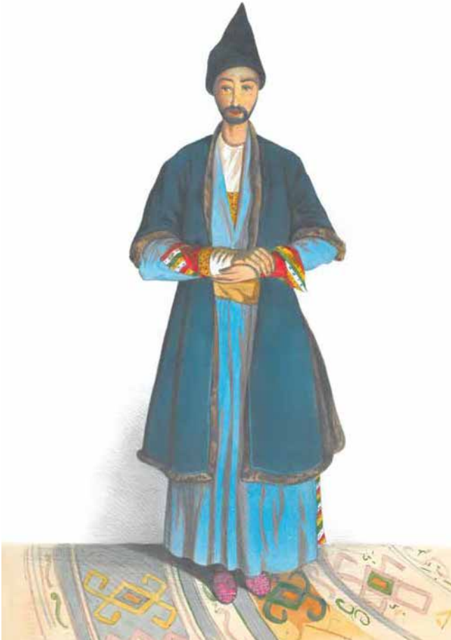
Prince G.G. Gagarine. Tatar de Irevan (aquarelle de la série « Costumes du Caucase ») années 1840