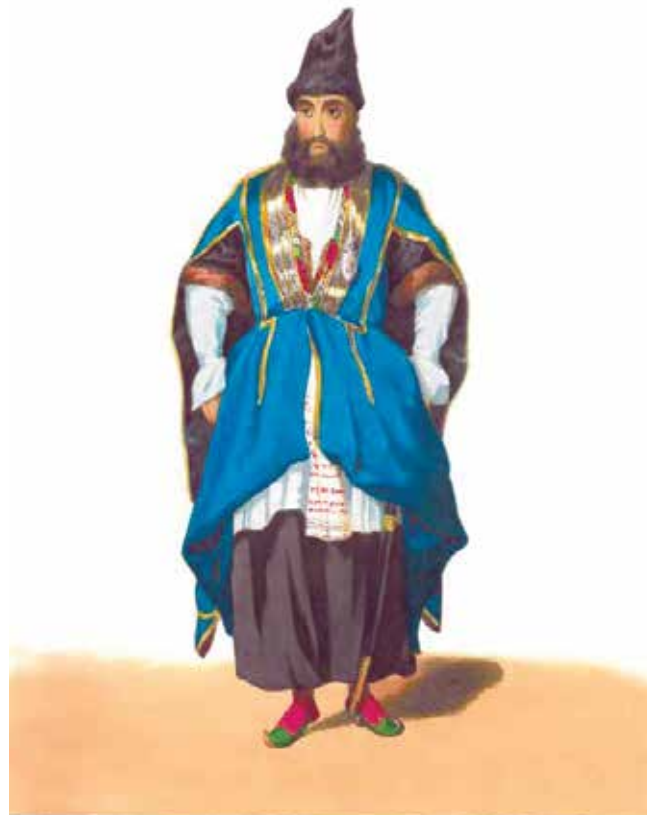
Prince G.G. Gagarine. Tatar de Bakou (aquarelle de la série « Costumes du Caucase ») années 1840

Il est tout à fait possible que ce projet, ainsi encouragé, de liens économiques étroits entre la Russie et les peuples du Caucase conquis par elle ait servi de base au projet plus vaste d'un rapprochement culturel du Caucase avec la Russie et l'Europe , auquel le prince s'attaqua à peu près à la même période. Grâce à son habileté à créer des images aussi bien au fusain qu'à l'aquarelle et à l'huile, il réalisa une série de toiles dépeignant l'existence quotidienne autant que les hauts faits des soldats et officiers du Corps franc du