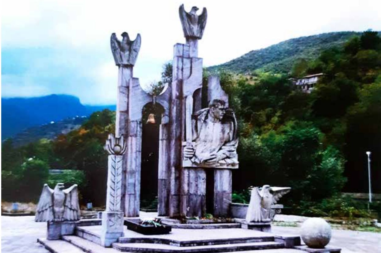
Памятник Гарегину Нжде в Капане (Армения)

За что Нжде был осужден в СССР и почему его героизируют в современной Армении?