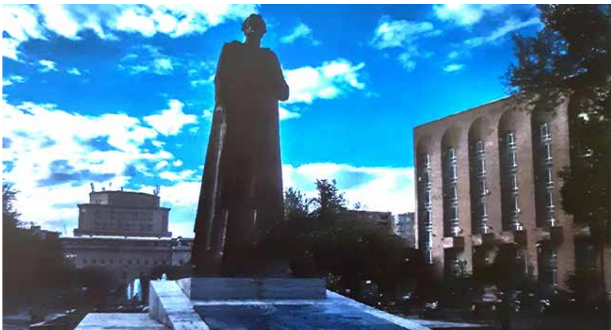
Памятник Гарегину Нжде в Ереване (Армения)

В процессе подготовки документов к публикации прояснились еще два существенных обстоятельства, связанные с героизацией Нжде в Армении. Оказывается, архивные документы совет-