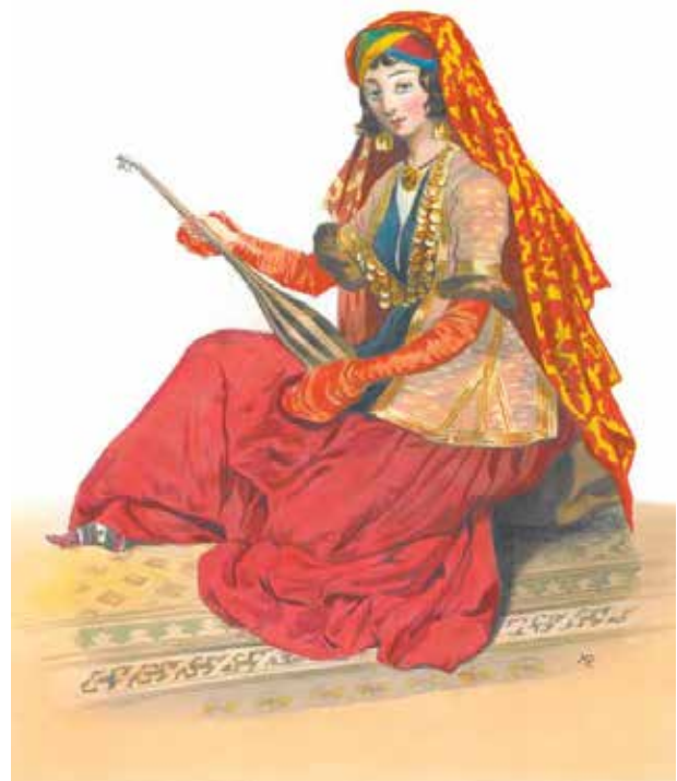
Князь Г.Г. Гагарин. Женщина из Шемахи (акварель из серии «Костюмы Кавказа»), 1840-е гг.