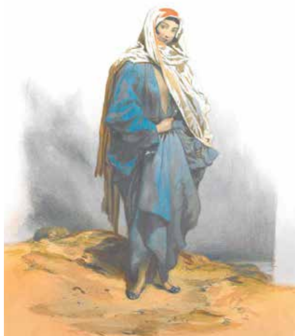
Князь Г.Г. Гагарин. Женщина из Кубы (акварель из серии «Костюмы Кавказа»), 1840-е гг.

paysages, meurs et costumes du Caucase. Paris, 1845-1852.