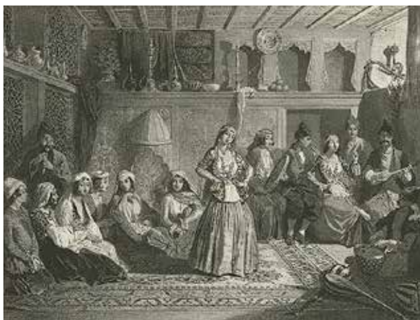
Князь Г.Г. Гагарин. Ширван. Танцовщица из Шемахи (гравюра из серии "Живописный Кавказ"), 1840-е гг.

Князь Г.Г.Гагарин родился в семье видного российского дипломата, общественного деятеля и литератора князя Григория Ивановича Гагарина (1782-1837), который для своего времени был человеком неординарным. Долгое время он служил в составе дипломатических миссий в Вене, Стамбуле и Париже, состоял при главнокомандующем русской армии в войне с Наполеоном 1806-1807 гг. бароне Л.Л.Беннигсене, участвовал в российско-французских переговорах, предшествовавших заключению Тильзитского мира. Во время Отечественной войны 1812 года на собственные средства сформировал конный полк и на протяжении всей войны являлся его командиром, находясь при этом в должности государственного секретаря в свите Александра I. Здесь на него «особое внимание» обратила М.А.Нарышкина, любовница императора, родившая от князя внебрачного сына. Бурный роман закончился отставкой князя на 10 лет и высылкой вместе со всем семейством за границу, где он, вернувшись на дипломатическую службу, до смерти состоял в должности посла сначала в Риме, а затем в Мюнхене. В Риме он патронировал молодых русских художников, которых Академия художеств посылала в Италию «для усовершенствования в искусствах», благодаря чему искренними друзьями его сына Григория стали всемирно известные живописцы Орест Кипренский и Карл Брюллов [4, С. 18-19].