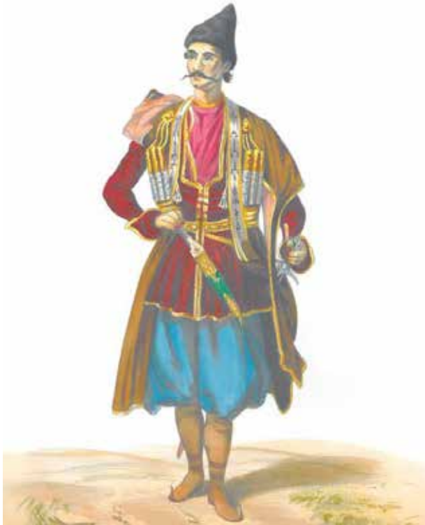
Князь Г.Г. Гагарин. Хан Карабаха (акварель из серии «Костюмы Кавказа»), 1840-е гг.