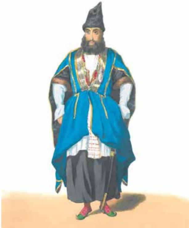
Князь Г.Г. Гагарин. Татарин из Баку (акварель из серии "Костюмы Кавказа"), 1840-е гг.

второй трети XIX столетия. Украшения и вышивка на одежде женщин, богато инкрустированное оружие, пояса и обувь мужчин говорят о высоком развитии ремесла у кавказских народов, которые хотя и имели племенной характер организации общественной жизни, но ее сословно-социальная структура в принципе ничем не отличалась от российской или европейской. Князь Григорий Гагарин благодаря своему чутью художника одним из первых понял это и попытался через художественные образы и средства, понятные европейцам, донести до зрителей красоты природы и душу народов Кавказа.