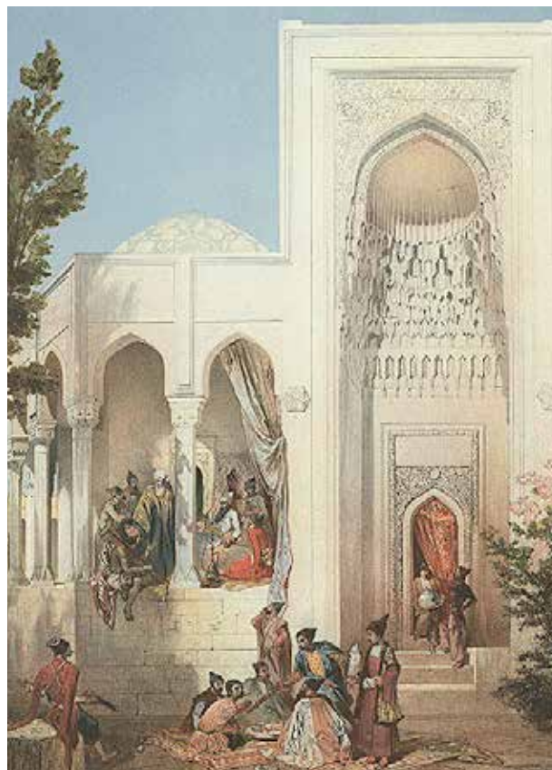
Князь Г.Г. Гагарин. Абшерон. Дворец хана Баку (акварель из серии "Живописный Кавказ"), 1840-е гг.

В силу перечисленных обстоятельств его сын, князь Григорий Григорьевич, свои детские годы провел за границей, благодаря чему сумел получить классическое образование в пансионе Таломеи (Arco Dei Tolomei) в итальянской Сиене, славившемся филологическим и художественным преподаванием, а по окончании его в 1826 году на протяжении 13 лет находился на дипломатической службе, пройдя все ступени карьерной лестницы до секретаря российского посольства в Мюнхене, которое долгие годы возглавлял его отец. Смерть отца оставила его без покровительства по службе, а отсутствие свободных средств заставило в 1839 году вернуться в Россию, где он сразу был принят в общество молодых петербургских литераторов, особенно сблизившись среди них с М.Ю.Лермонтовым.