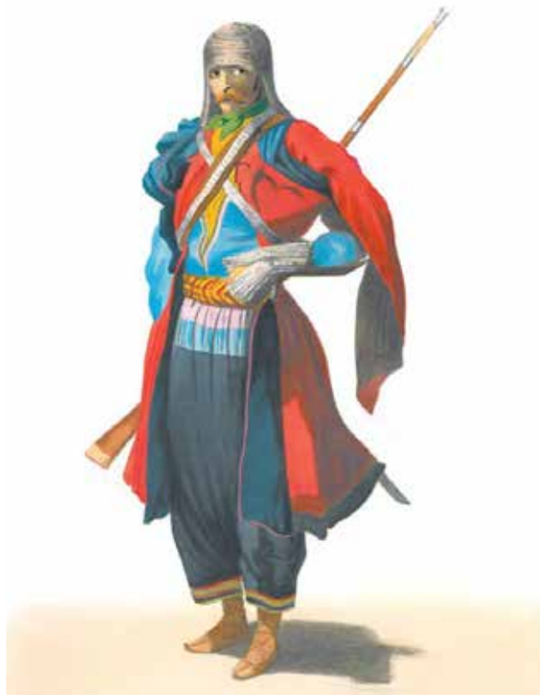
Князь Г.Г. Гагарин. Солдат из Гянджи (акварель из серии «Костюмы Кавказа»), 1840-е гг.

выехал и князь Г.Г.Гагарин, который поступил на службу в состав Отдельного Кавказского корпуса волонтером. По воспоминаниям современников, М.Ю.Лермонтов и князь Г.Г.Гагарин жили в одной палатке, вели общее хозяйство и совместно практиковались в графике: Лермонтов рисовал гравюры, а Гагарин их раскрашивал акварельными красками. До наших дней дошло несколько их совместных работ, самой известной из которых является «Сражение при Валерике» , изображающих фрагмент боя 11 июля 1840 г. на реке Валерик в 30 км от крепости Грозная (ныне Грозный) в ходе экспедиции русских войск против восставших горцев [2].